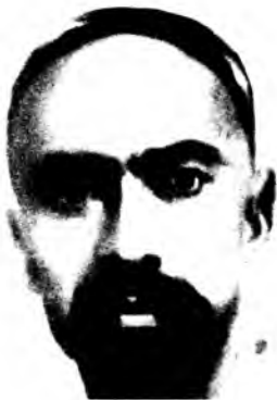
ХУРШИД (ШАМСИДДИН ШАРАФИДДИНОВ) (1892—1960)

У ўзбек шеърятининг ғазал ва қўшиқчилик бобида ўзига хос мактаб яратиб, аруз вазнидан муваффақиятли фойдаланган катта истеъдод соҳибидир. Шоир 1982 йили 92 ёшида вафот этди.